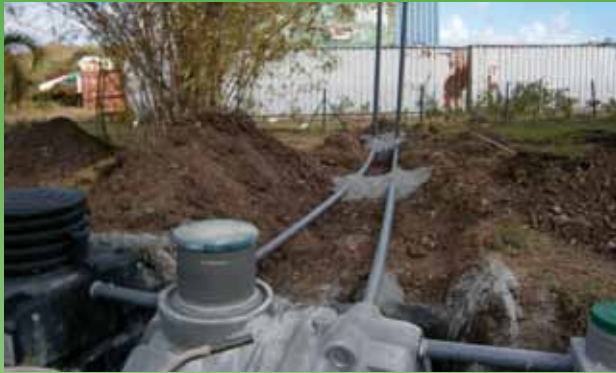
Visit of proper execution of the pre-treatment sector and the treatment in accordance (new).