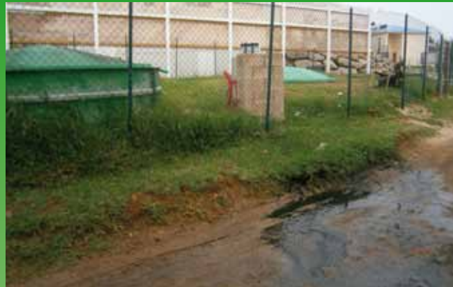
Station wastewater treatment (STEU) in malfunction: no maintenance.