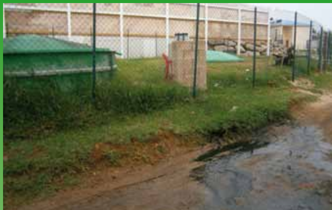
Station traitement des eaux usées (STEU) en dysfonctionnement : pas d'entretien.