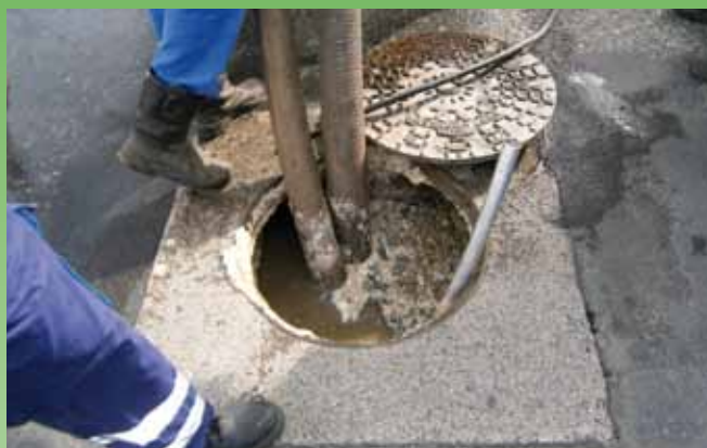
Vidange d'un bac à graisse : entretien.