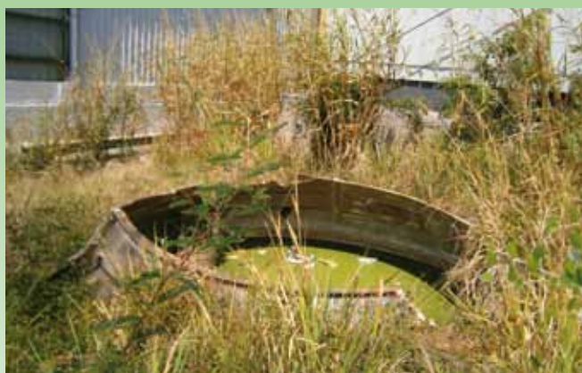
Station de traitement des eaux usées à l'abandon : problème pour la santé et la sécurité publique, problème environnemental.