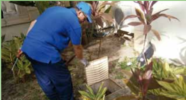
Visit of the manholes.