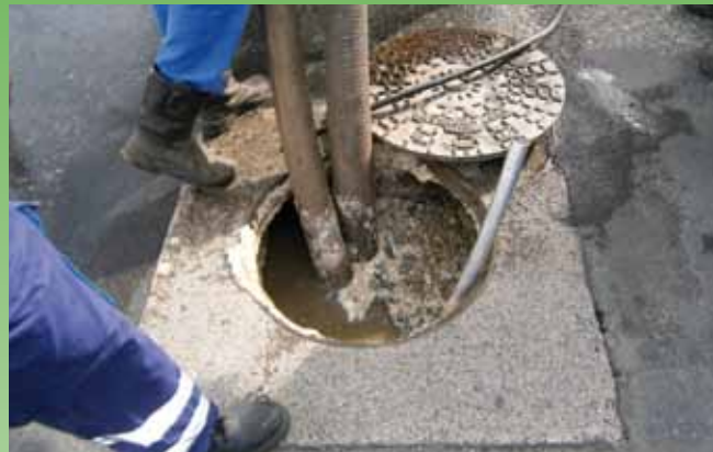
Draining of a grease trap: maintenance.