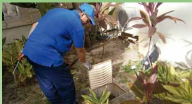
Visite des regards de collectes.