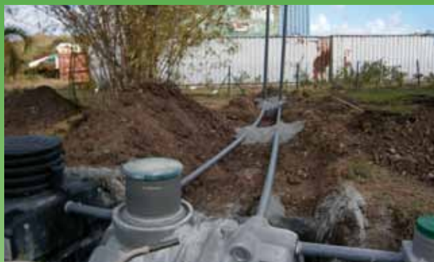
Visite de bonne exécution de la filière de prétraitement et de traitement conforme (neuf).