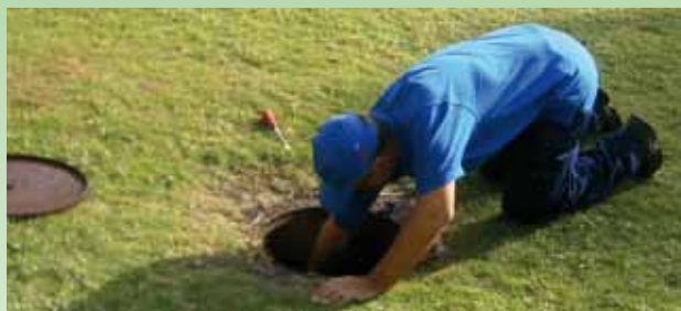
Diagnostic de la fosse toutes eaux.